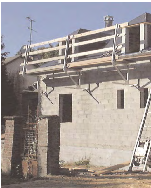
Échafaudage sur consoles