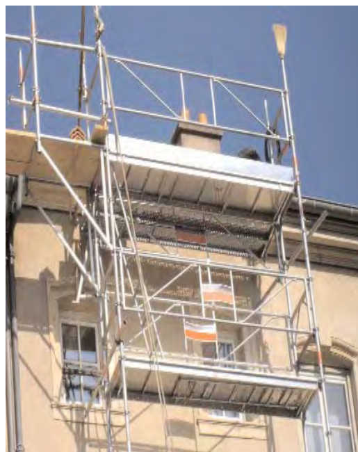
Échafaudage de pied