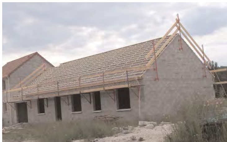
Protection de bas de pente