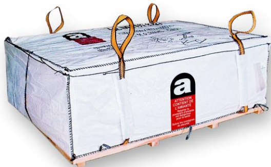
Dépôt Bag sur palette