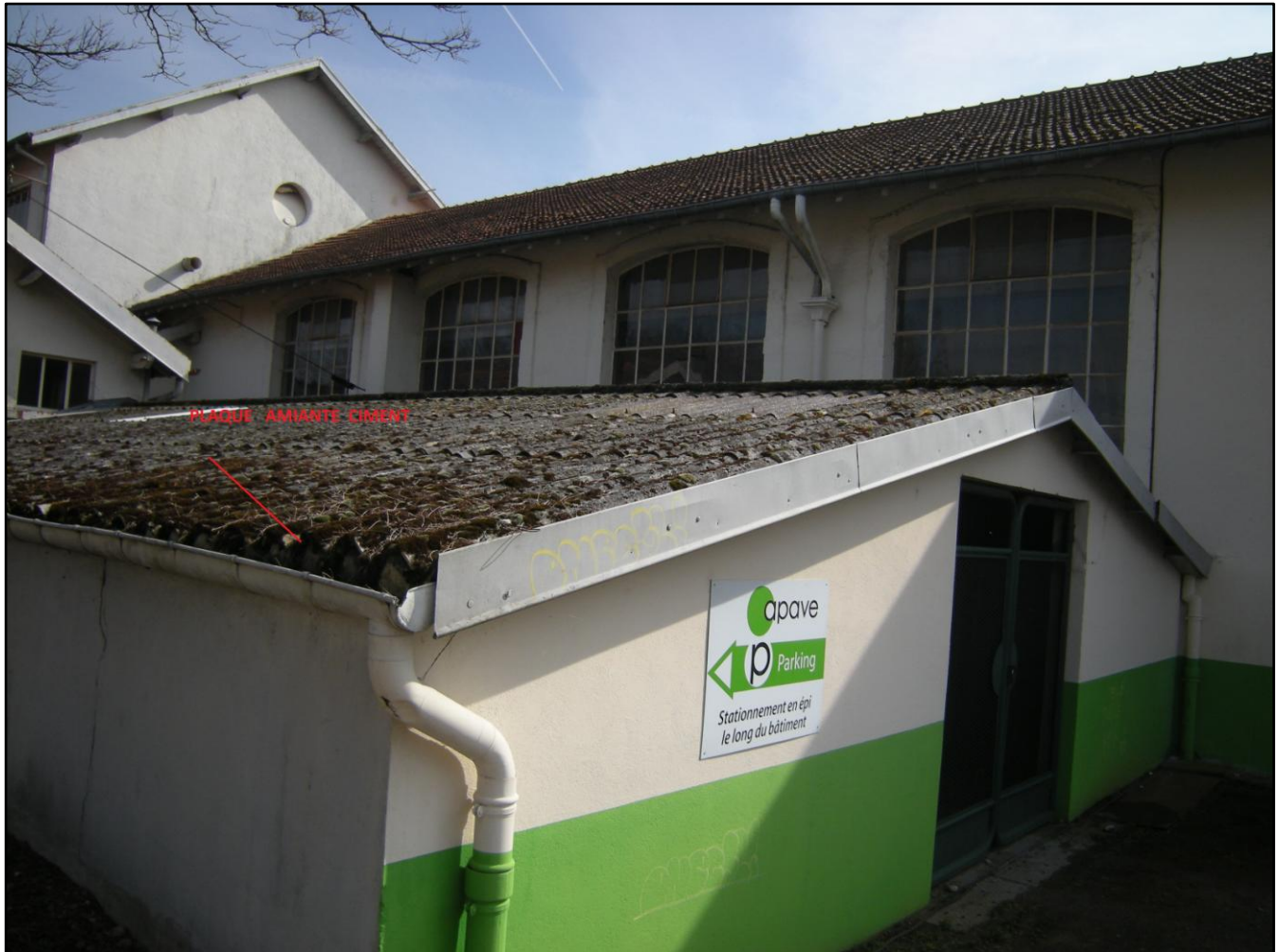
GARAGE EXTERIEUR CENTRE FORMATION