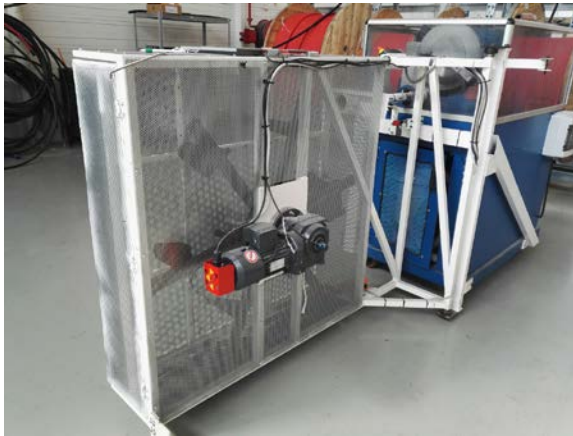
Machine qui permet d'enrouler les câbles