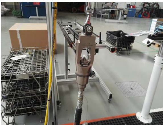
Outil qui permet de sertir