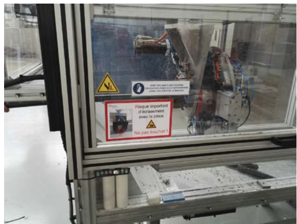
Machine qui permet de dénuder un câble